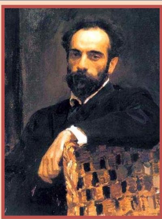
Левитан Исаак Ильич